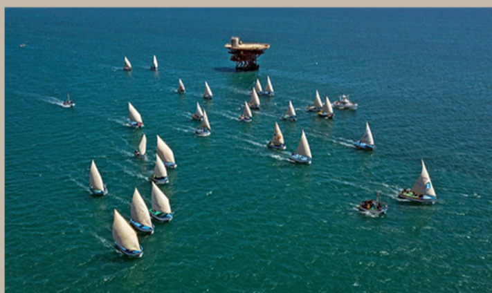
CUNA DE LA REGATA ANUAL DE LAS EMBARCACIONES A VELA ORGANIZADA POR GREMIO DE PESCADORES ARTESANALES.

CLIMA PRIVILEGIADO TODO EL AÑO MAR, NATURALEZA Y UN RITMO QUE INVITA A DESCONECTARSE DEL RUIDO Y RECONECTAR CON LO ESENCIAL.