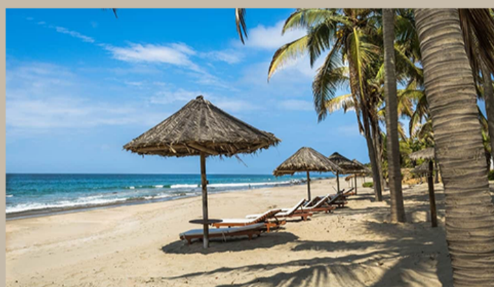
MÁS DE 2000 KM DEL LITORAL PERUANO HAN COBRADO RELEVANCIA INTERNACIONALMENTE.