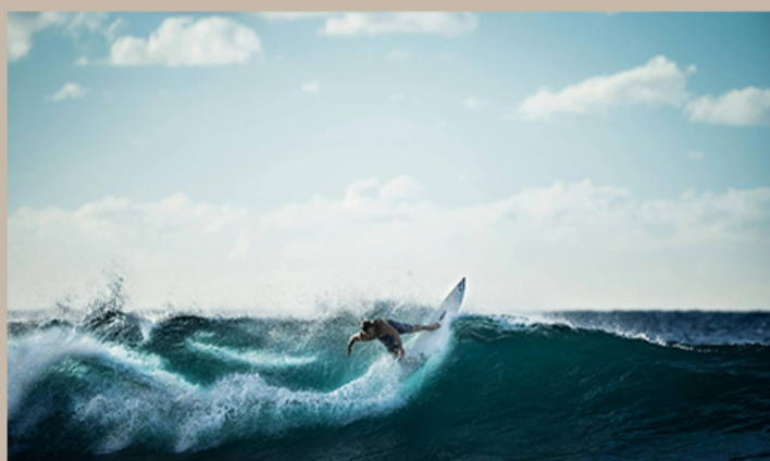
UNO DE LOS PRINCIPALES DESTINOS PARA LOS AMANTES DE LAS OLAS DE OCTUBRE A MARZO.

VIVE MÁNCORA TODO EL AÑO Y DESCUBRE TODO LO QUE PUEDES ENCONTRAR EN ESTE PARAISO