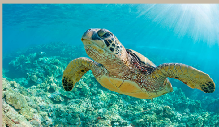
LAS PLAYAS BRILLAN POR SU BELLEZA Y BIODIVERSIDAD EN ESPECIAL PARA LAS TORTUGAS QUE ANIDAN EN LA ZONA.

CLIMA PRIVILEGIADO TODO EL AÑO MAR, NATURALEZA Y UN RITMO QUE INVITA A DESCONECTARSE DEL RUIDO Y RECONECTAR CON LO ESENCIAL.